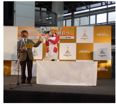
ここが見所!ステージ