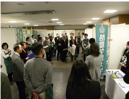
ブースプレゼンテーション