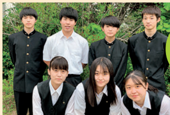
北海道帯広農業高等学校