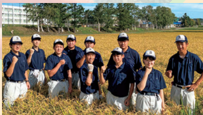
北海道岩見沢農業高等学校